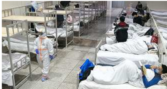
中国の感染者隔離の状況

○世界の状況 各国当局の発表に基づきAFPがまとめた統計によりますと日本時間18日現在の世界の新型コロナウイルス感染者数は145の国・地域で19万7千人に達し、うち7千8百人が亡くなっています。世界保健機関(WHO)はパンデミック＝世界的な大流行になっているという認識を示し、危機感を表明しました。