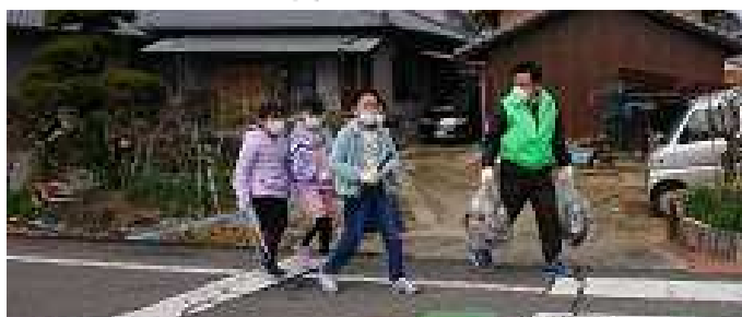
スポーツゴミ拾いに参加した子ども会の皆さん

よく降った前日の雨もやんだ、3月1日、「第1回スポーツゴミ拾いin牟礼町」を開催しました。各校区より5チーム集まり9時40分スタートし、制限時間内に決まったエリアの中を4、5人でチームを作りゴミを拾いその量と種類を競うスポーツは気がつかないところ以外とゴミは落ちています。子どもたちは、興味津々でいろんなところを探してまるで宝探しをしているようです。ゴミ拾いをスポーツ競技として行うことで他のチームより少しでも多く拾って勝ちたいという思いが出て力が入ります。これをきっかけに「なんでこんなところに落ちてるんだろ」と考え環境問題に興味を持ってもらえたらいいと思います。一時間で集めたゴミは22kgありました。