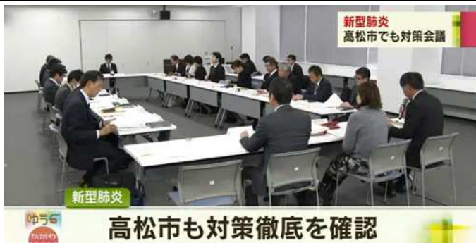
高松市も対策徹底を確認

中国から発生した新型コロナウイルスは世界で感染をを広げ、日本においても日々、感染が広がっています。政府は拡大予防対策を段階的に発表し、それを受けて香川県、高松市も具体的な行動や予防措置を実施しています。