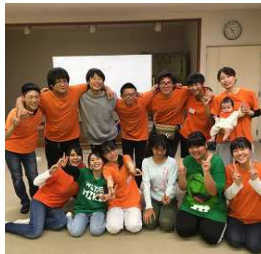
子ども会活動や地域のイベント支援、次世代の地域活動リーダーを育成する仲間たち

化において子どもたちを通じて得られる一体感や、大人と子どもが大勢で一緒に遊ぶことのような機会がほかに無いので、このように活動が今後も長く続けられるようにジュニア・リーダークラブが支援・協力・指導助言などの活動をしていきたいと思ひます。