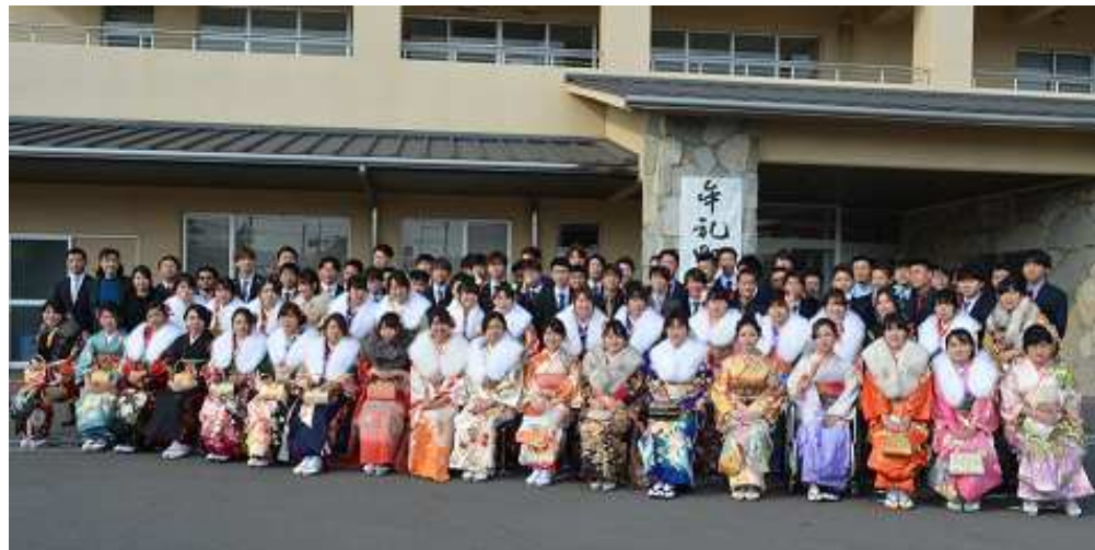
令和元年度 牟礼地区成人式 集合写真

スーツに身を包んで参加しました。ビンゴ大会や思い出のスライド上映などで歓声が上がるなど久しぶりの同級生が親交を深めていました。