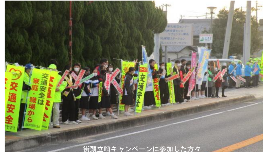
街頭立哨キャンペーンに参加した方々