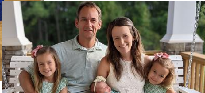
ダニエルグレース新市長ファミリー

関わりのある方が新市長になられたことは本当に喜ばしく、何か縁の深さ、絆の強さを一層感じられました。近年のコロナ禍で高校生の交流は休止していますが、今後はダニエルグレース新市長の協力を仰ぎながら再度できる日を楽しみに交流を続けてまいります。