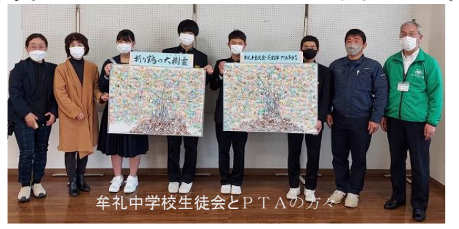
牟礼中学校生徒会とPTAの方

例年、牟礼中生とPTAで学校や地域の公園等の清掃活動を行っています。今年度は感染症拡大防止のため、計画が中止となっていました。日頃、お世話になっている地域に、他の方法で恩返しができないかと生徒 1月3日の地域成人式でも飾っていただけの先輩たちへのお祝いにもなりました。折り鶴で作った大きな樹の精霊が、地域も私たちの未来も優しく見守ってくれることを願っています。