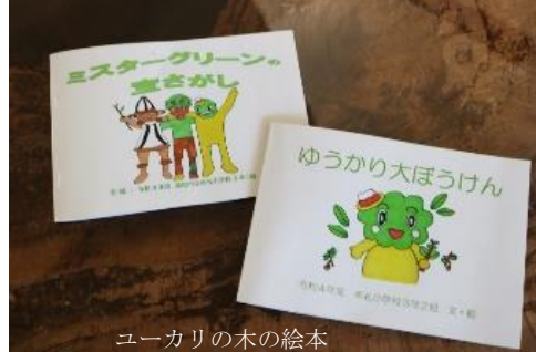
ユーカリの木の絵本

牟礼小学校生からの言葉 私たちは、昨年、ユーカリの木のことを牟礼のみんなに知ってもらっために絵本を作りました。お話の内容やキャラクターは、クラスで話し合っ決めました。ユーカリが、牟礼小のシンボルとして大事にされてきたことが分かるように、地域の方から聞いたお話をエピソードに入れました。この絵本を読んで、ユ