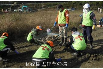
瓦礫撤去作業の様子

東日本大震災で被災された方々の復興の応援をするため、2011年10月に設立し、2016年1月にNPO法人化した。東北やその後の大規模災害被災地にも赴き、復旧支援活動を行っています。一度被災すると復興まで長い年月が掛ります。被災地では、瓦礫撤去だけでなく、炊き出しや復興住宅等で「手作りうどん教室」を開催し、心の交流も行います。また、南海トラフ地震に備え、ほとんど被災経験がない香川の人たちに「命を守る行動の大切さ」や備えの大切さを伝える防災啓発活動を行っています。