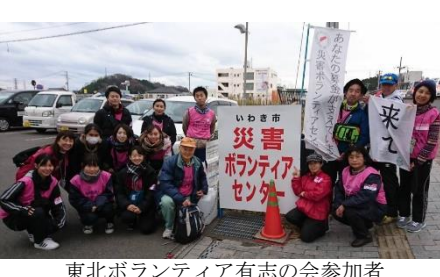
東北ボランティア有志の会参加者