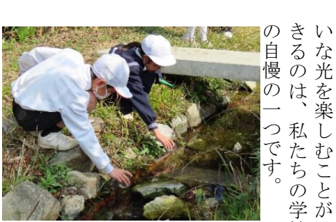
ホテルの幼虫を放流している様子

牟礼南小学校 木んがの泉、清き泉 牟礼南小学校の北庭には、「ホテルかがやきの里、あけまの泉」という大きなビオトープがあります。約20年前に誕生したこのビオトープでは、たくさんのホテルが飛ぶようになり、その環境が悪くなり、ホテルの姿が見えなくなりました。そこで、10年前にもう一度ホテルが住める環境を復活させようとPTAと先生方の力で、今のよう整備された姿になりました。本校では、総合的な学習の時間に3年生がホテルの学習をしています。たまごから育てた幼虫が、無事に成長するように、住む場所をきれいにしたり、幼虫の水そうの