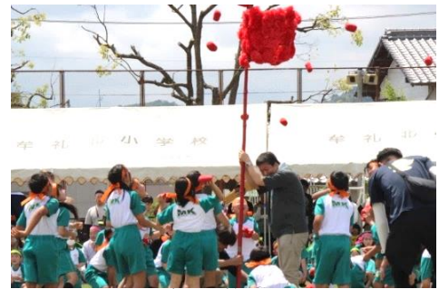
運動会での競技の様子

牟礼北小学校 第48回春期運動会開催!! 5月20日(土)に、第48回春期運動会が開催されました。運動会前日はあいにくの天気でしたがPTAの皆様や地域の皆様と共にグラウンドの水抜きを行うなど、運動会当日に子どもたちが精一杯の演技ができるように準備を行いました。さて、今年度は久しぶりの全校生一斉の運動会になりました。「協力してあきらめずベストをつくそう」のテーマのもと、子どもたちは、徒競走、表現、児童会種目、子ども会種目等を全力で行いました。精一杯の演技に対して精一杯の応援をする子どもたちの様子、地域や保護者の皆様と協力しながら準備や片付けをする様子