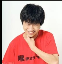
喉押さえマン(高松市出身)