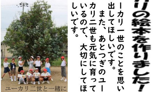
ユーカリ二世と一緒に

牟礼南小学校 木んがの泉、清き泉 牟礼南小学校の北庭には、「ホテルかがやきの里、あけまの泉」という大きなビオトープがあります。約20年前に誕生したこのビオトープでは、たくさんのホテルが飛ぶようになり、その環境が悪くなり、ホテルの姿が見えなくなりました。そこで、10年前にもう一度ホテルが住める環境を復活させようとPTAと先生方の力で、今のよう整備された姿になりました。本校では、総合的な学習の時間に3年生がホテルの学習をしています。たまごから育てた幼虫が、無事に成長するように、住む場所をきれいにしたり、幼虫の水そうの