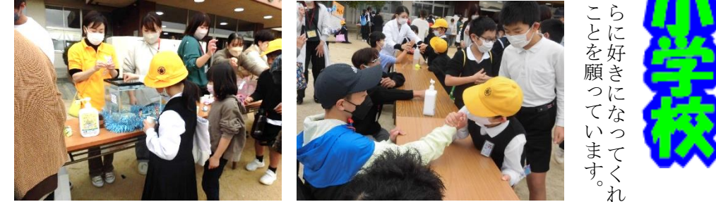
昨年度のふるさとまつりの様子

昨年度、牟礼南小学校のふるさとまつりでは、コロナ禍でも児童の思い出に残る行事にしようと「ミニ縁日」が開催されました。水中コイン落とし、スパーボールすくい、くじ引き、わなげ、うでずもうの5つのコーナーが用意され、友達同士や親子で夢中になって活動を楽しみ姿が見られました。 また、獅子舞も披露され、その迫力に児童は圧倒されていました。 今年度は、コロナの規制が緩和されましたので、食パズルやリンゴ販売を復活させる予定です。また、新しい取り組みとして、「南っ子ステーション」と題して、児童や保護者の希望者による芸大会を企画しています。ふるさとまつりを通して、児童が牟礼の町をさ