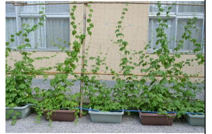
すくすく育つ、緑のカーテン(ゴーヤ)